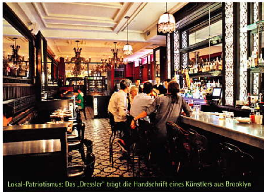
Lokal-Patriotismus: Das „Dressler“ trägt die Handschrift eines Künstlers aus Brooklyn